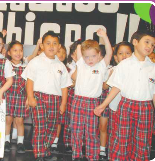
Los pequeños del "My Little English" cantaron en honor del Obispo las canciones "Alzar las manos" y "Dulce Madre".